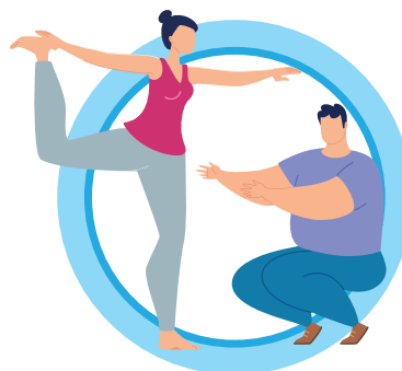
ВЕДИТЕ ЗДОРОВЫЙ ОБРАЗ ЖИЗНИ