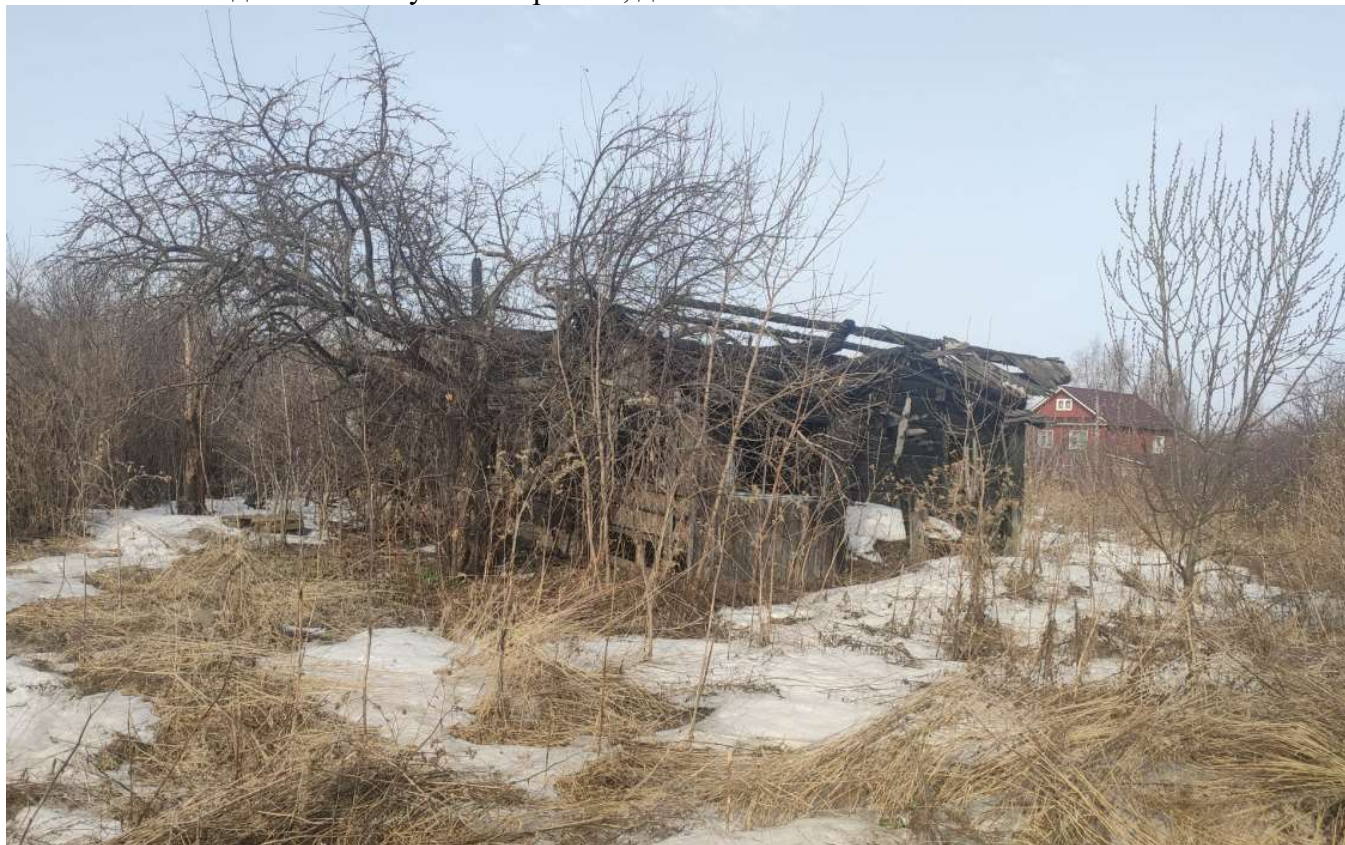
Фото объекта недвижимости ул.Октябрьская, д.146