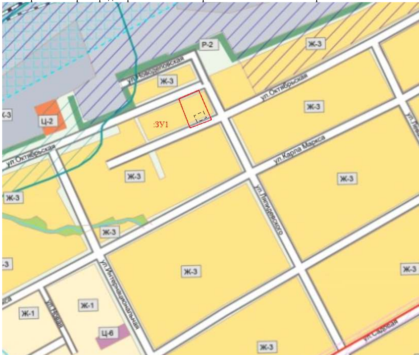
Рис. Фрагмент карты градостроительного зонирования с нанесенными охранными зонами

В соответствии с Правилами землепользования и застройки городского округа город Шахунья Нижегородской области (утвержденные решением Совета депутатов городского округа город Шахунья Нижегородской области от 28.03.2019 г. № 26-11), формируемый участок расположен в зоне малоэтажной смешанной застройки индивидуальными и малоэтажными жилыми домами (Ж-3).