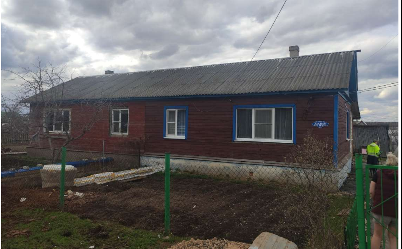
Фото объекта недвижимости Лесная д.10