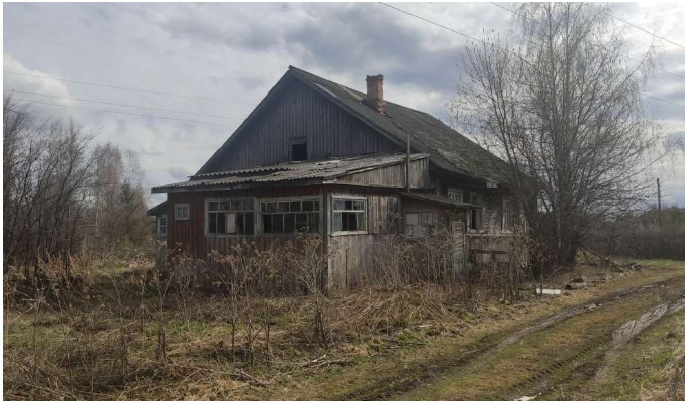
Фото объекта недвижимости Лесозаводская д.6