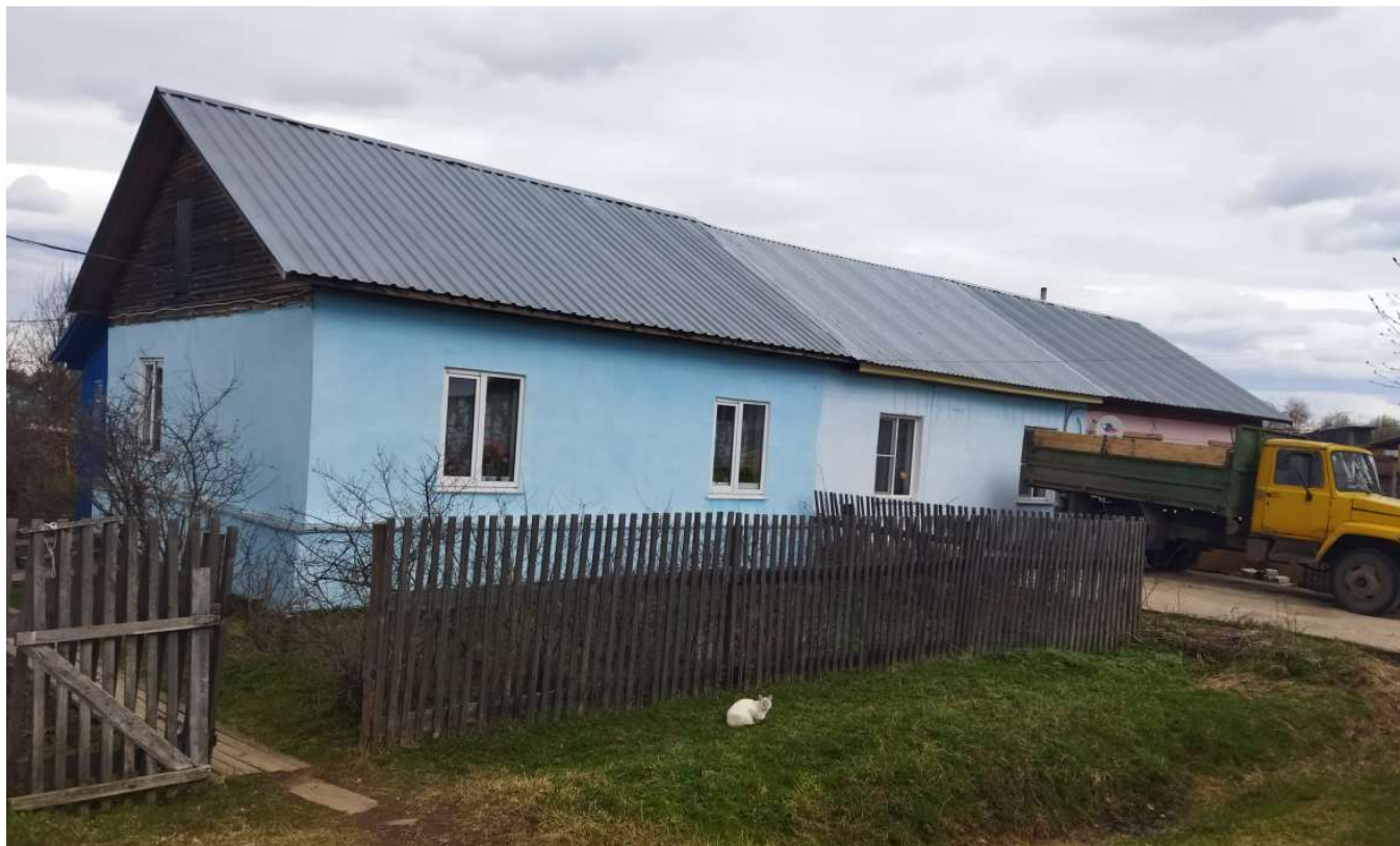
Фото объекта недвижимости 8 Марта д.36