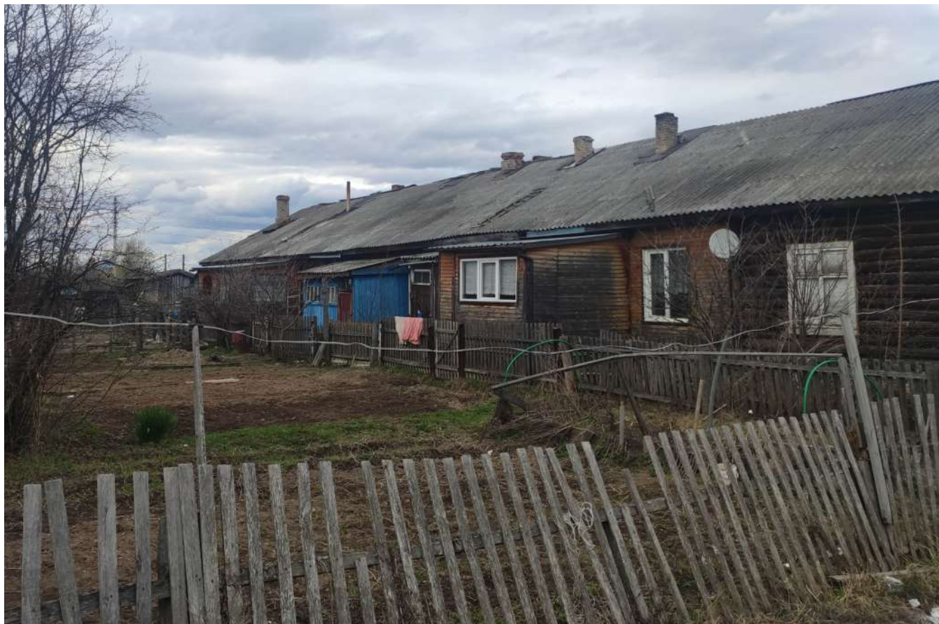
Фото объекта недвижимости пер.Сенной д.16