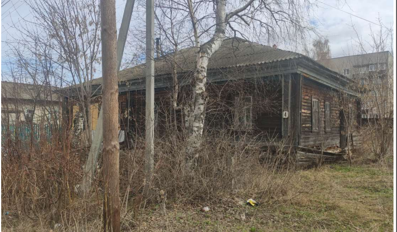
Фото объекта недвижимости Ярославского д.4