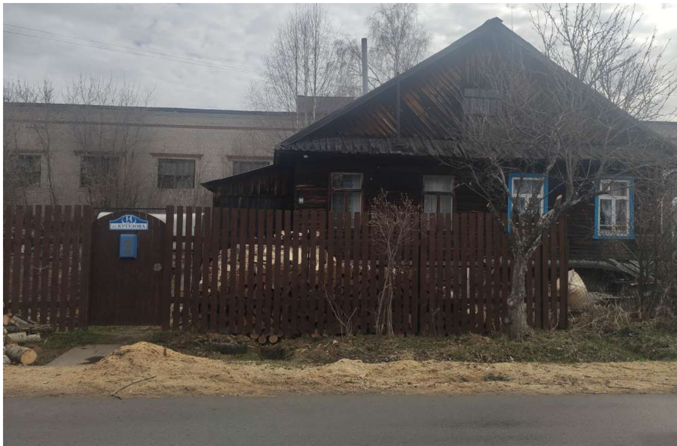
Фото объекта недвижимости Кутузова д.14