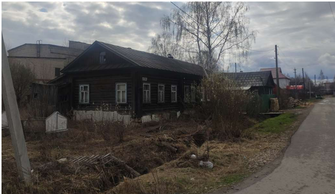
Фото объекта недвижимости Кутузова д.16