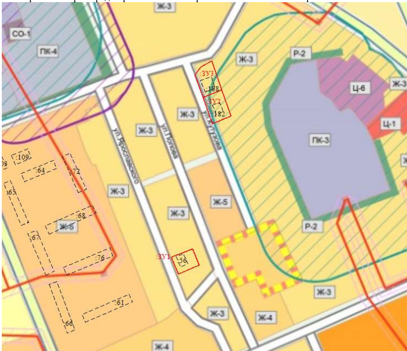
Рис. Фрагмент карты градостроительного зонирования с нанесенными охранными зонами

В соответствии с Правилами землепользования и застройки городского округа город Шахунья Нижегородской области (утвержденные решением Совета депутатов городского округа город Шахунья Нижегородской области от 28.03.2019 г. № 26-11), формируемый участок расположен в зоне малоэтажной смешанной застройки индивидуальными и малоэтажными жилыми домами (Ж-3)