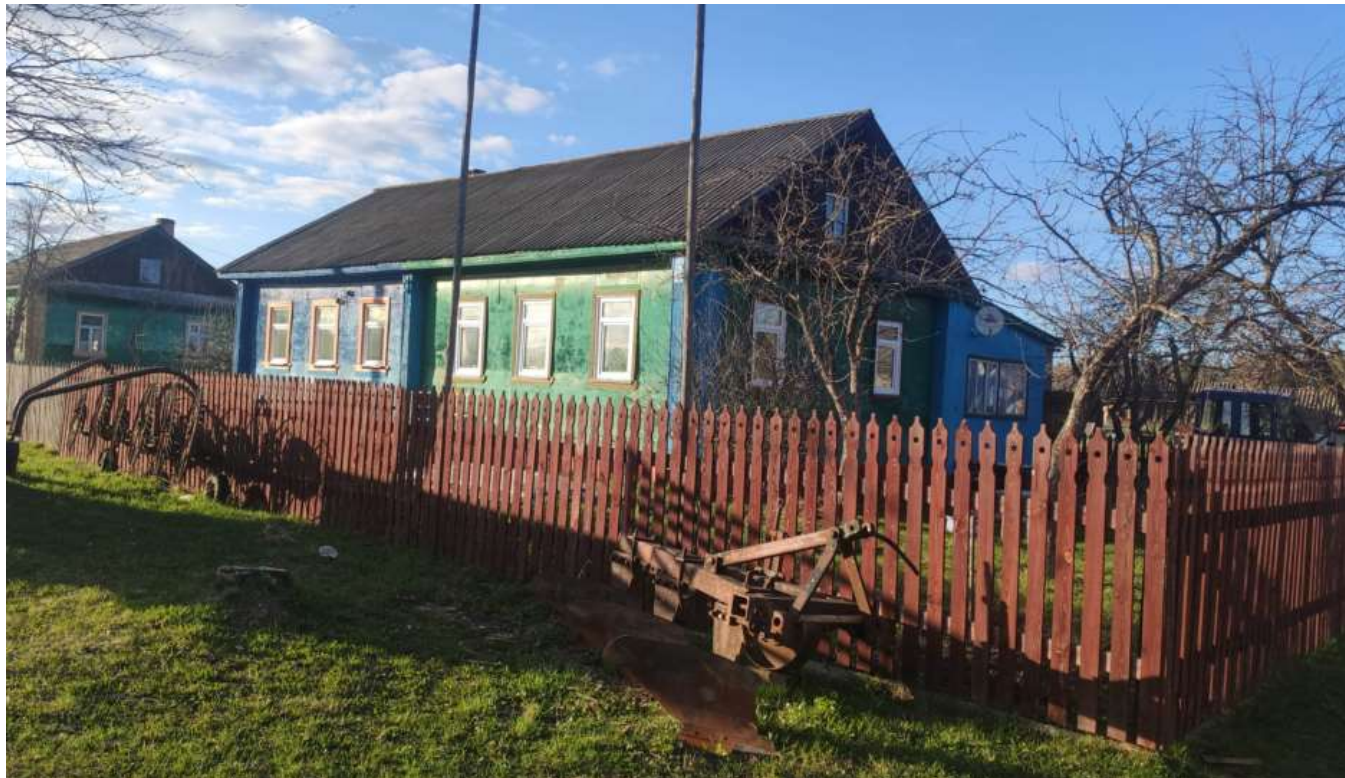
Фото объекта недвижимости ул.Мира, д.8