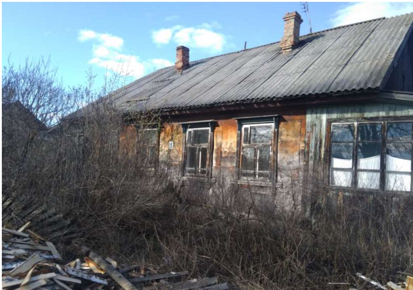
Фото объекта недвижимости ул.Пушкина д.20