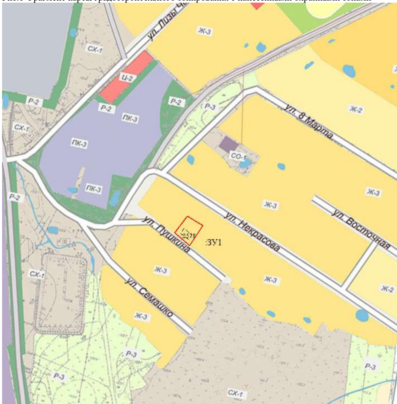
Рис.1 Фрагмент карты градостроительного зонирования с нанесенными охранными зонами

В соответствии с Правилами землепользования и застройки городского округа Шахунья Нижегородской области (утвержденные решением Совета депутатов городского округа город Шахунья Нижегородской области от 28.03.2019 г. № 26-11), формируемые участки расположены в зоне Ж-3.