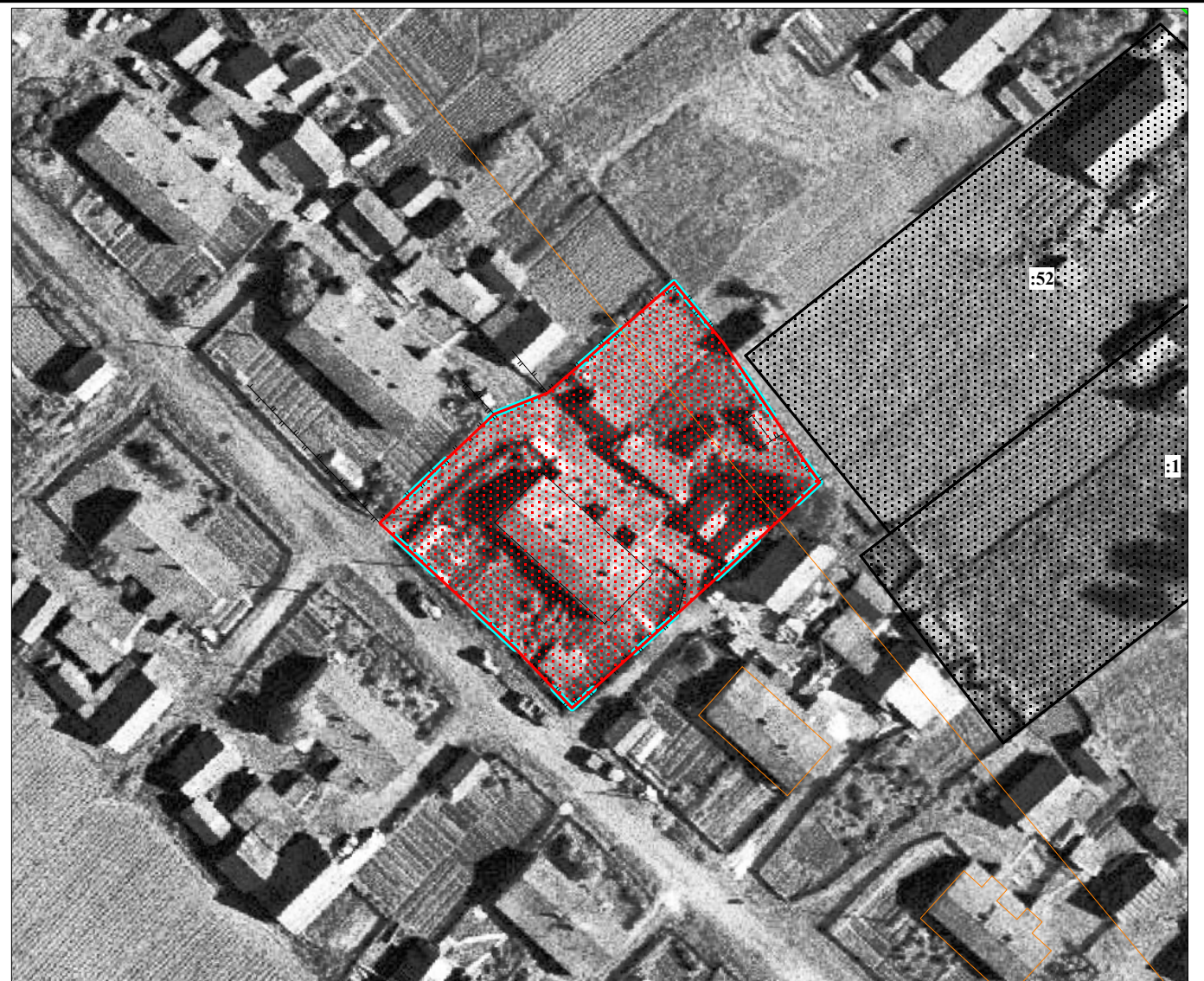
Масштаб 1 : 1 000