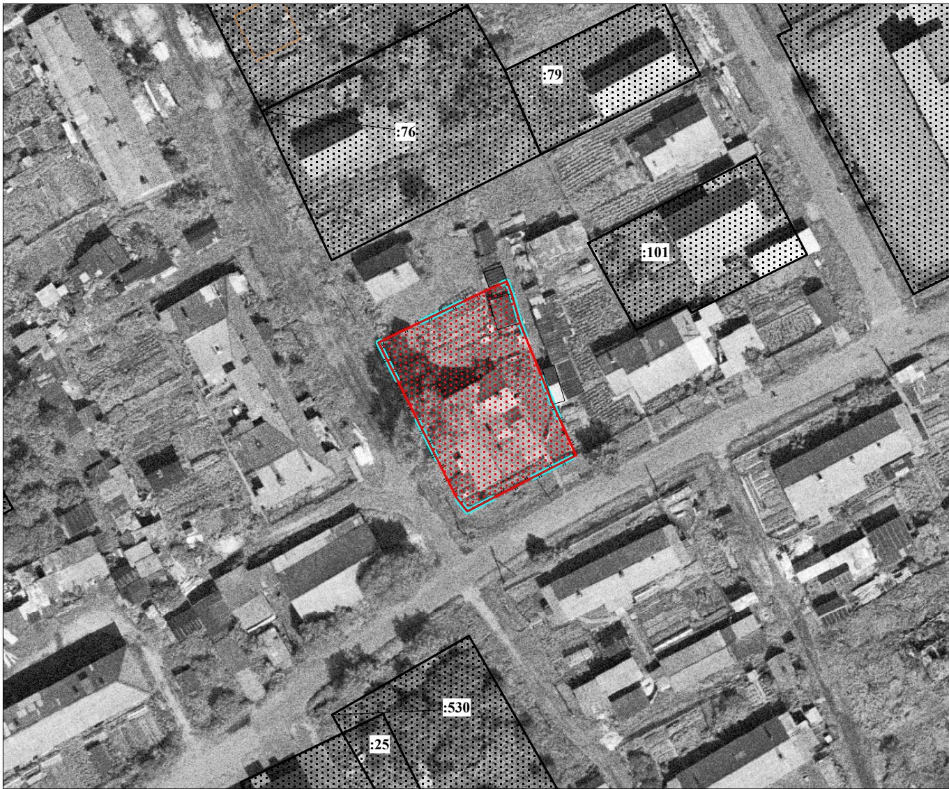
Масштаб 1 : 1 000