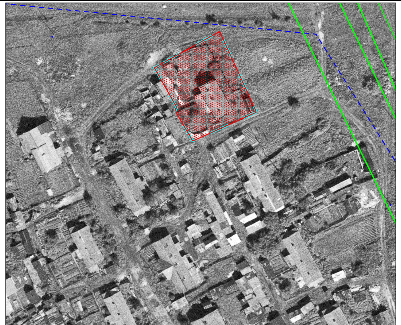
Масштаб 1 : 1 000

Земельный участок образуется в соответствии со следующими материалами и сведениями: