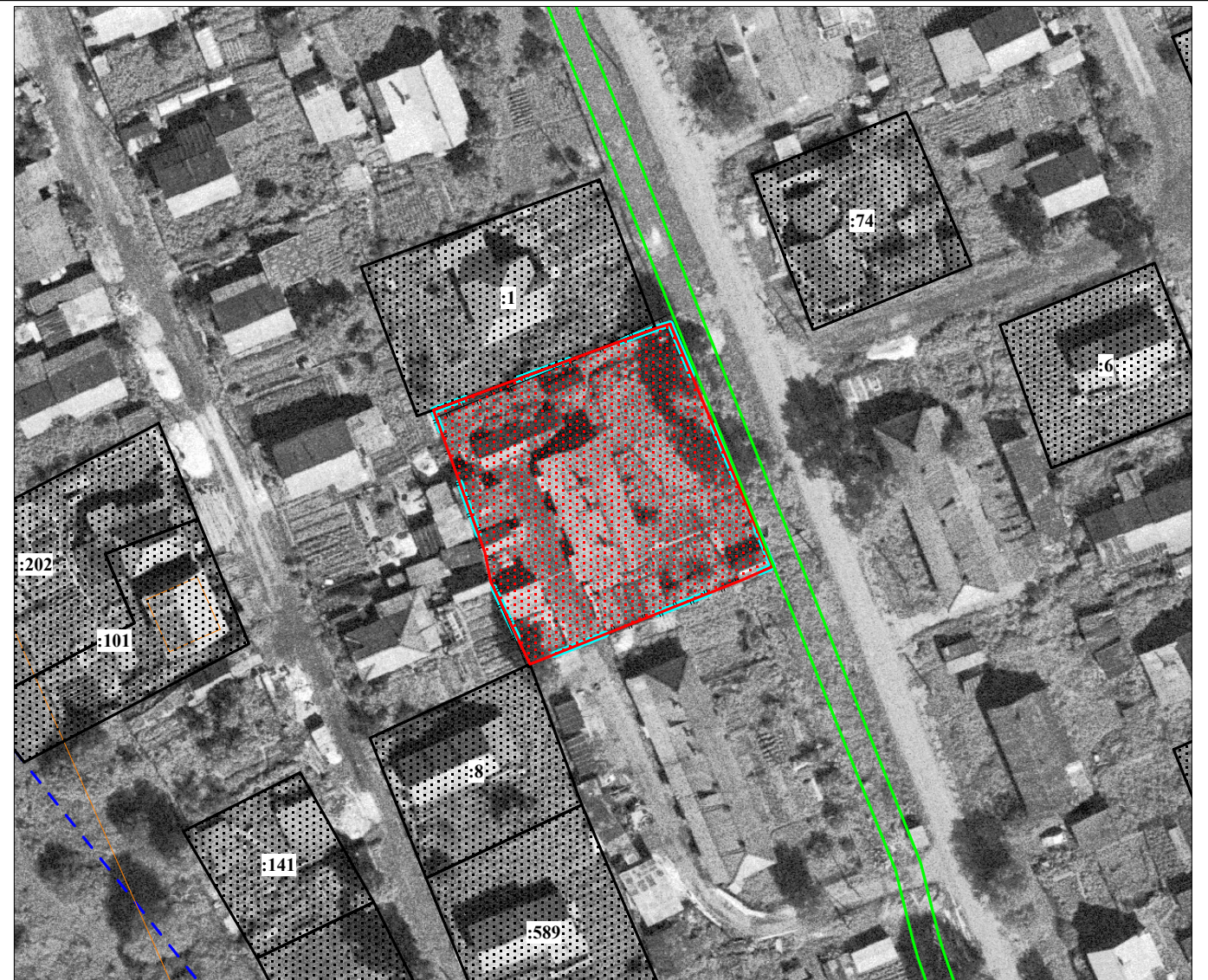
Масштаб 1 : 1 000