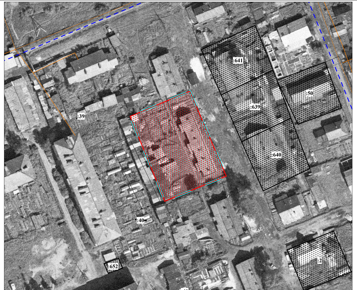
Масштаб 1 : 1 000

Земельный участок образуется в соответствии со следующими материалами и сведениями: